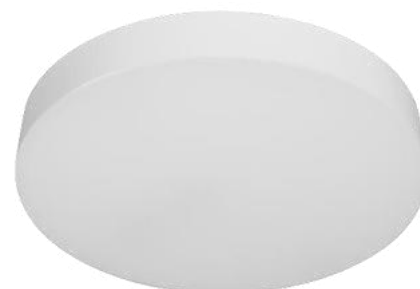
ILUDOWNSOB24WWWR ILUDOWNSOB24WNWR ILUDOWNSOB24WWR

Sin posibilidad de atenuación (Driver DOB).