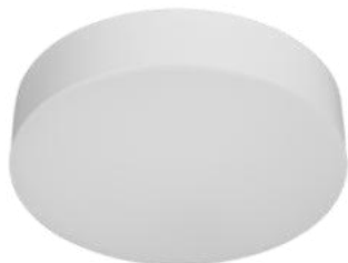
ILUDOWNSOB18WWWR ILUDOWNSOB18WNWR ILUDOWNSOB18WWR

Sin posibilidad de atenuación (Driver DOB).