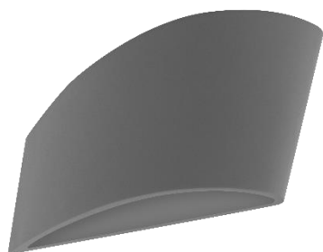
ILUEUR8022CG Concreto acabado gris

POR FAVOR LEER EL MANUAL ANTES DE USAR EL PRODUCTO (DEPENDIENDO MODELO).