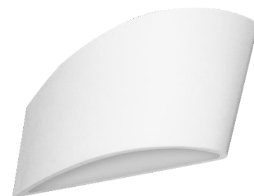
ILUEUR8022YW Yeso acabado blanco

Este producto se usa como elemento de iluminación sobrepuesto en muro, incluye base E14 (no incluye lámpara). Características de la base E14 incluida: 277 V ~ 25 W (0.2 A) máximo 50/60Hz